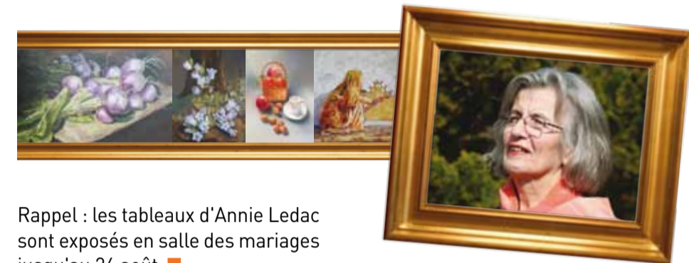
Rappel : les tableaux d'Annie Ledac sont exposés en salle des mariages jusqu'au 26 août.