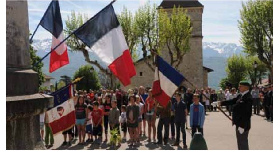
Lors de la cérémonie du 8 mai, Madame le maire et les enfants présents ont déposé la gerbe au pied de notre monument aux morts.