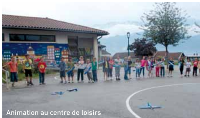
Animation au centre de loisirs

C'est également pour palier différents besoins que sera livré en novembre 2013 un bâtiment de 300 m 2 dans l'enceinte de l'école Clos Marchand. Cette structure composée de quatre pièces accueillera, en effet, une annexe de la cantine de l'école toute proche. Trois pièces modulables seront dédiées aux activités du Centre de loisirs (les mercredis et vacances scolaires), aux associations et au Relais Assistantes Maternelles. Ces dernières disposeront ainsi, à Saint-Ismier, d'un espace autorisant un temps collectif pour les assistantes maternelles du canton. La réunion, en un même lieu, de toutes ces activités est un atout formidable pour maintenir et favoriser le lien entre les générations.