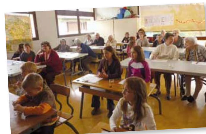
Semaine Bleue - école autrefois

La spécificité des animations organisées à Saint-Ismier tient dans leur conception. Elles sont en effet toujours pensées pour rassembler toutes les générations, même si leur thème s'adresse à un âge particulier. Ainsi la chasse aux œufs, par exemple, qui remporte depuis trois ans un vif succès, propose aux enfants la traditionnelle partie de chasse aux œufs en chocolat mais les adultes participent également aux nombreux stands et animations présents lors de cette manifestation. De même, « Cinétoiles » réunit dans le parc de la Mairie de nombreuses familles autour d'un pique-nique, de jeux et d'un film jeune public. Cet événement, en partenariat avec la Communauté de Communes Le Grésivaudan, le Comité des fêtes et la Mairie, a rassemblé plus de 700 personnes en 2012 ! Dans le même esprit, la Semaine Bleue, semaine nationale des retraités et des personnes âgées, organisée en octobre, propose de nombreuses animations accessibles à tous. À Saint-Ismier, cet événement, dont le thème sera cette année « Vieillir et agir ensemble dans la communauté », est organisé en collaboration avec les enfants du centre de loisirs, la médiathèque, l'Agora, le CCAS et les deux maisons de retraite de la commune. De nombreuses animations seront proposées