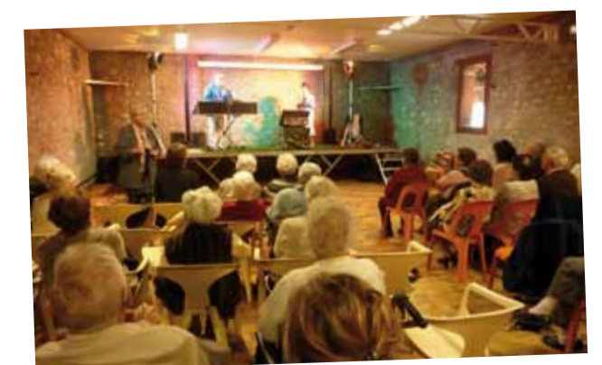
Semaine Bleue - chansons françaises