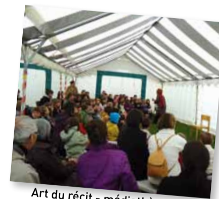
Art du récit - médiathèque